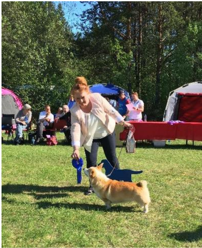
Siggens Strawberry Daiquiri BIG 2 på Rallautstillingen i mai